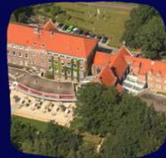
KONTAKT DER KONTINENTEN