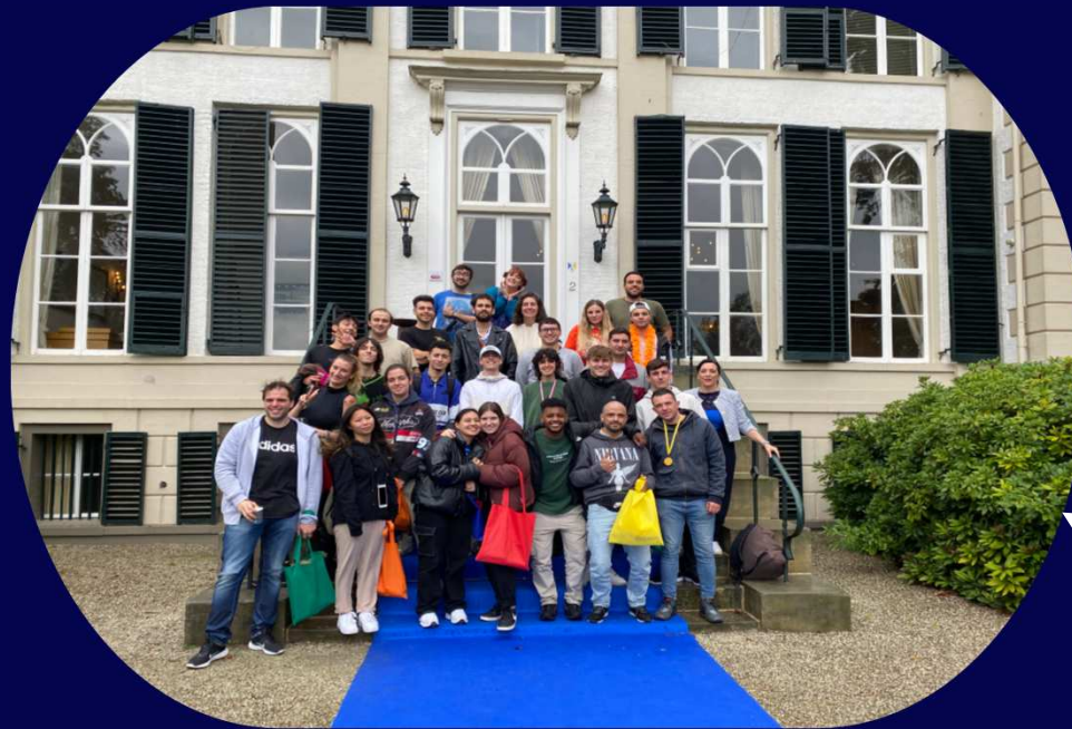
Summer Event 2023 'LA TRIBU'

Creando una TRIBU, una comunidad que comparte, apoya e impulsa el crecimiento