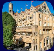
EDEN HOTELS AMSTERDAM