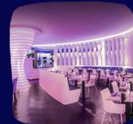
SHIKI SUSHI & LOUNGE