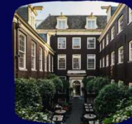
THE DYLAN AMSTERDAM