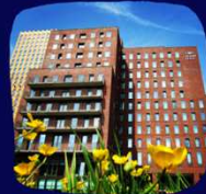
CROWNE PLAZA AMSTERDAM SOUTH