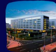
STEIGENBERGER AIRPORT HOTEL