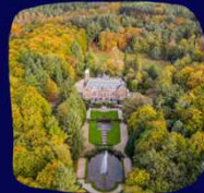
KASTEEL DE HOOGHE VUURSCHÉ