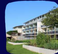
VAN DER VALK ARA