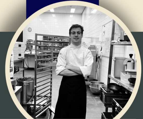
Emilio CIFP Paseo das Pontes Chateau Sint Gerlach, Valkenburg 2023

“ Imagínate... 400 platos llenos de productos frescos, cocinados con el máximo cuidado y con 100% de consistencia, saliendo de la cocina al mismo tiempo. Aquí llevamos los banquetes al siguiente nivel ”