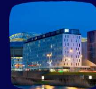
JAZ IN THE CITY AMSTERDAM