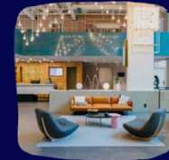
HOTEL CASA AMSTERDAM