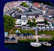
FLOW THE COLLECTION