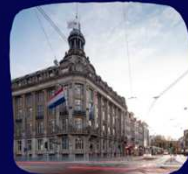
PPHE HOTEL GROUP