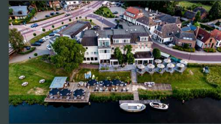
Carlota CIFP Carlos Oroza Hotel de Zon & Hooge Graven Ommen 2023

“ Estoy orgullosa de ser parte del equipo de cocina de Gerard. Es un ambiente dinámico y nos da espacio para la creatividad. Ommen es un lugar precioso ”